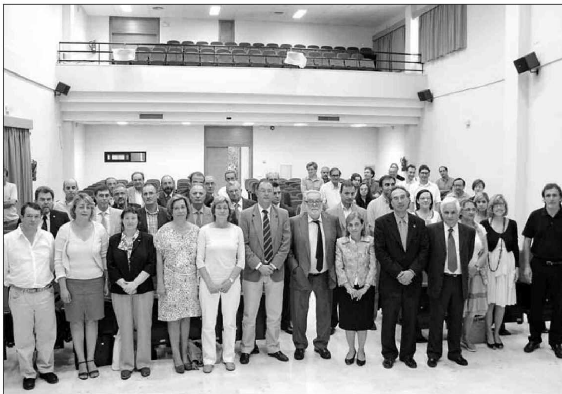
Foto de familia de los representantes de las entidades que recibieron el reconocimiento.