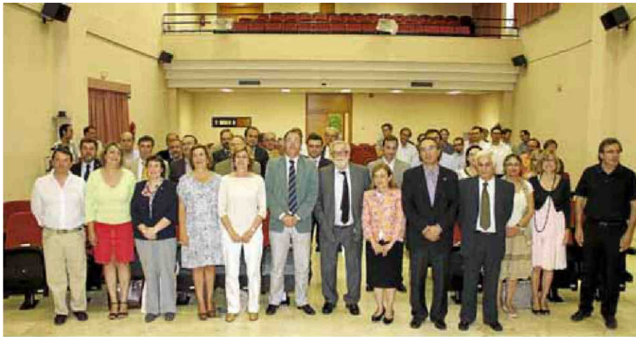
Retrat de família de tots els participants en l'acte d'ahir, celebrat en honor a la UIB.