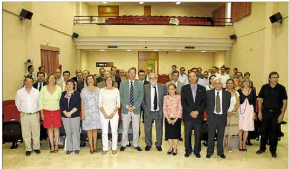
El acto contó con representantes de las cátedras y de la Universitat.

La UIB reconoció ayer, por primera vez, en un acto público el mecenazgo de las dieciocho cátedras institucionales y de empresa que tiene la institución. Estas cátedras colaboran en el desarrollo de programas de investigación y de innovación, de promoción y difusión del conocimiento y la cultura, o de formación de estudiantes de grado y de posgrado. La más antigua, la Cátedra Unesco-Sa Nostra, es de 1998.